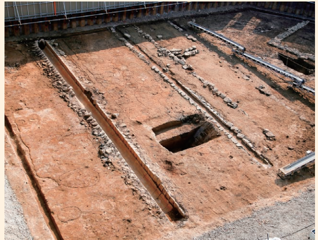
2条の石積み溝（北西から）

調査では、現地表から約1mの深さで、石積みの溝や瓦の詰まった穴が見つかりました。このうち、東西方向にまっすぐな2条の溝は、近代以降に造られたもので、絵図に描かれた屋敷地間の通路にほぼ重なることから、通路の両側溝と考えられます。溝間の距離は6.2mで、調査区外西側の現道幅とほぼ一致し、江戸時代の屋敷地割を踏襲していることが分かります。(氏平昭則)