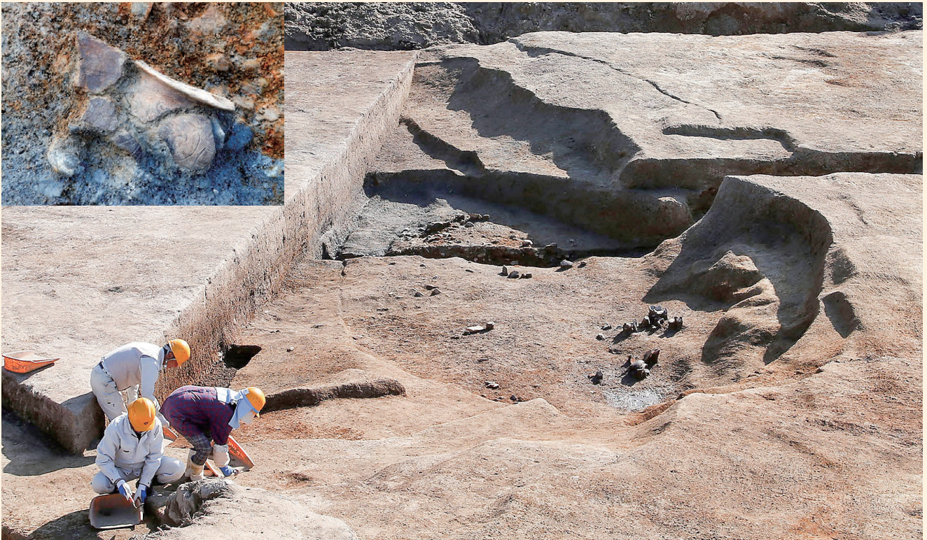
縄文土器が見つかった川の跡(北から)

また、もう一方の川の跡では、約30mにわたって川岸に沿うように木杭を打ち込み、枝木を組み合わせた護岸 まがき が見つかりました。この護岸は、古墳時代後期~室町時代(約1,400~600年前)の間に作られたと考えられます。通常、土に埋もれた木は腐って分解してしましますが、今回は水分量の多い土に埋まっていたため、残りが良い状態で見つかりました。(森本直人)