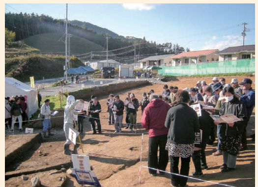
台の下遺跡の現地説明会（気仙沼市）