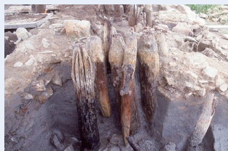
多数打ち込まれた橋脚