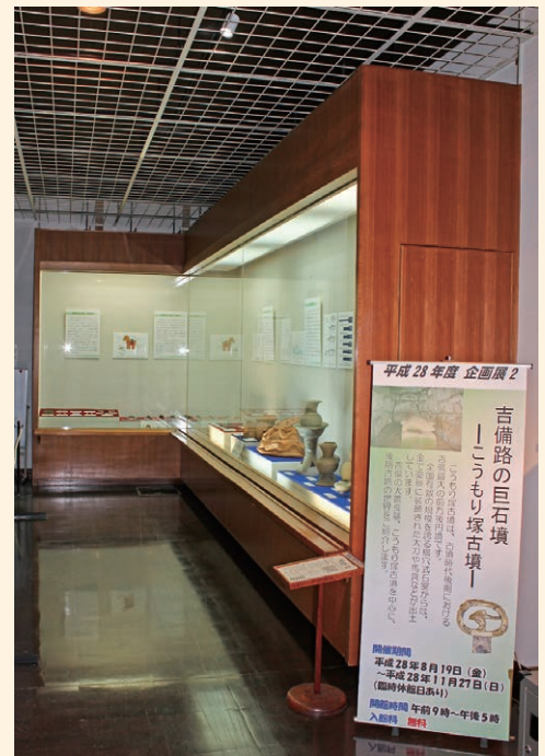
企画展2の開催状況

4月26日（火）から8月17日（水）まで、企画展1として「土器をよむ1」と題した展示を行いました。これは、弥生土器や土師器に残る製作・焼成・使用の痕跡から、どのような情報が読み取れるのか、分かりやすく展示・解説したものです。8月19日（金）から11月27日（日）には、企画展2「吉備路の巨石墳－こうもり塚古墳－」として、吉備路を代表する史跡こうもり塚古墳や江崎古墳の出土品を中心に、吉備の後期古墳文化を紹介する展示を行いました。現在は、平成29年1月11日（水）から4月19日（水）までの予定で、企画展3「山なみを越えて」を開催しています。これは、岡山県立博物館において開催された岡山・鳥取文化交流事業Ⅱの展示と連携したもので、山陰や北陸といった日本海沿岸地域とのつながりを示す吉備の出土品を展示し、中国山地を越えた交流の歴史を紹介しています。また、5月10日（火）から6月30日（木）には、「吉備の貌（かたち）」と題した特別展示を開催しました。倉敷で開催されたG7教育大臣会合に合わせて企画したもので、弥生時代から古墳時代の吉備を代表する絵画土器や造形品を集めて展示しました。センターでは、来年度も引き続き吉備の埋蔵文化財の魅力を紹介していきますので、ぜひ一度ご覧ください。