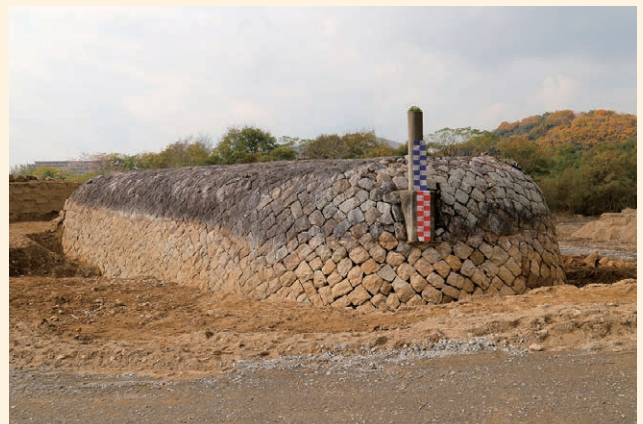
下流側の巻石全景（東から）