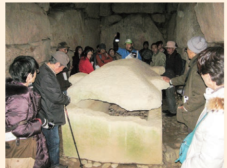
バスツアーの様子

近年、3次元計測やレーザー測定の成果はめざましく、造山・作山古墳についても、畿内の大形前方後円墳との墳丘の比較研究をより高い精度で行うことが可能となっています。発表では、前方後円墳の墳丘を構成する重要な要素である「造出し」 つくりだ について、位置や墳丘下段テラスとの高さの比などに注目し、その時期的変遷と造山・作山古墳の位置づけを明らかにしました。また、造山古墳と古市古墳群の ふるいち 菅田御廟山古墳の墳形を比べると、くびれ部の両側に「造出し」を備えることや前方部頂における方形壇の存在などが共通します。造山・作山古墳とも、古市古墳群の墳丘型式変化の流れの中にあり、両者の政治的な結びつきを意味していると考えられます。（弘田和司）