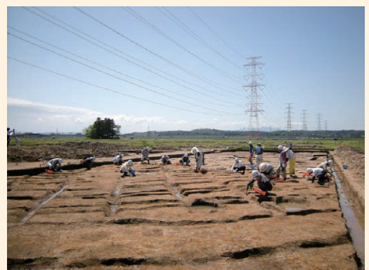
内館館跡の発掘調査（多賀城市）

両遺跡ともに発掘調査の成果を広く公開するため現地説明会を開催したところ、県内外から多くの方々の参加がありました。被災地の復旧・復興が進むなか、地域に愛着をもち、伝え守られてきた歴史や文化遺産に関心を寄せられる姿が印象的でした。（米田克彦）