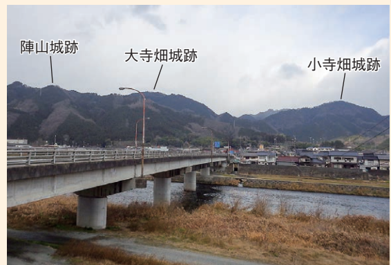
陣山城跡と大寺畑城跡・小寺畑城跡