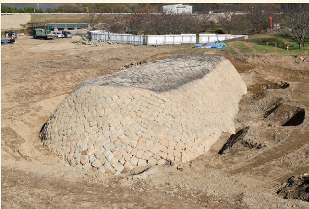
上流側の巻石全景（南西から）

一の荒手の巻石は、その歴史的意義を後世に伝えるため、補強工事を施したうえで現地保存される予定です。本誌前号で紹介した二の荒手と同様に、百間川の貴重な土木遺産のひとつとして、歴史学習や防災教育への活用が期待されます。(岡本泰典)