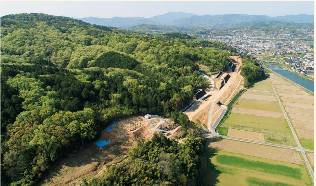
空から見た高尾北ヤシキ遺跡（南上空から）

また、調査区南側の浅い谷部では、多くの遺物を含む土（ ほうがんそう 遺物包含層）が厚く堆積しています。主な遺物として、弥生土器や石包丁、サヌカイト製石器、古墳時代後期から古代の土師器や須恵器、陶