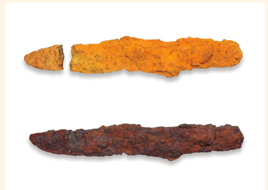
処理前(上)とサビ落とし・接合後(下)