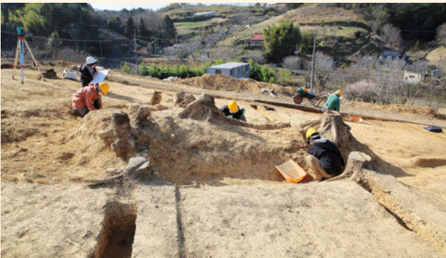
「ひょうたん塚」の調査（東から）

塚状遺構の北東側では、方形区画の中から江戸時代中頃以降の土葬墓が25基まとまって見つかりました。墓坑内からは多数の銅銭（寛永通宝）をはじめ、硯や陶磁器など、当時の埋葬習俗をうかがわせる多様な副葬品が出土しました。（岡本泰典）