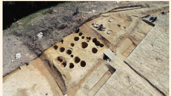
江戸時代の墓地（北西から）

百間川原尾島遺跡は、旭川の放水路である百間川の河川敷内を中心とする遺跡で、これまでの調査により弥生時代から古墳時代の拠点集落と考えられています。今回の調査地は百間川左岸側に位置し、過去の調査で弥生時代から中世にかけての居住域が確認された地点の北側にあたります。