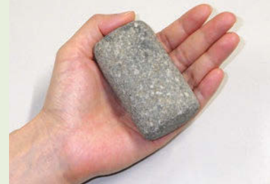
写真2 津島遺跡の「分銅」