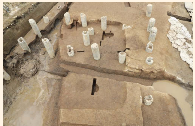
古墳時代後期の竪穴住居（東から）