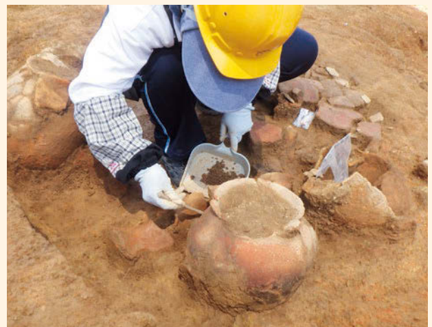
竖穴住居2の土器出土状況