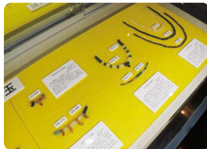
古墳時代の玉類の展示

会場：岡山県立図書館多目的ホール(岡山市北区丸の内) 日時：令和4年1月22日(土曜日) 午後1時～4時 定員：60名(県立図書館へ、事前申込が必要)