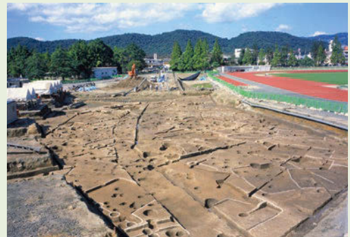
写真1 弥生時代後期から古墳時代の集落 竪穴住居がたくさん見つかりました

森本 晋 「弥生時代の分銅」『考古学研究』第59巻第3号 2012年 中尾智行 「弥生時代の計量技術—畿内の天秤権—」『考古学研究』第65巻第2号 2018年