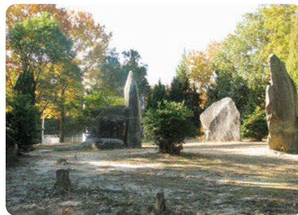
倉敷市楯築墳丘墓

第1回 縄文・弥生時代の墳墓、古墳時代の墳墓 日時：令和3年11月21日(日曜日) 午後1時30分～3時40分 第2回 古代の墳墓、中・近世の墳墓 日時：令和4年2月26日(土曜日) 午後1時30分～3時40分