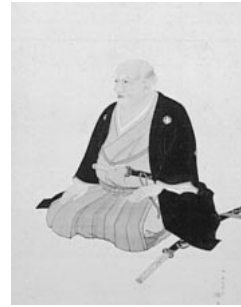
小野光右衛門 画像 岡山県立博物館蔵

江戸末期に西洋から入った新しい数学に対し、以前からわが国にあった数学を和算という。戦国から江戸初期のころには、築城などの土木普請や検地、江戸時代には商品の売買、金銭の貸借、土地の測量や暦の編纂など、実用の計算に欠かせない学問として発達した。江戸時代中期以降になると、岡山県内にも和算家として知られる人々が現れるようになった。