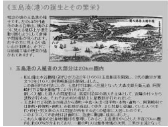
《玉島(港)の誕生とその繁栄》 現在の島の玉島の様子です。大正10年(1921)頃の玉島の様子。玉島の繁栄は、岡山県立中央図書館蔵の『玉島(港)の誕生とその繁栄』(岡山市立中央図書館蔵)に収録されています。玉島の繁栄は、岡山県立中央図書館蔵の『玉島(港)の誕生とその繁栄』(岡山市立中央図書館蔵)に収録されています。

ここで紹介する例は、まさにそれに当たるもので、現在、当館とのリンクを張っています。様々な地域情報を発信しているページです